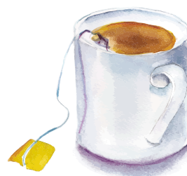
HRNEK S ČAJEM